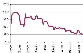
Индекс рубля к корзине валют